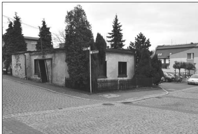
Po wyburzeniu tego budynku powiększy się parking na rynku.

Następny parking na około 20 miejsc powstanie przy gimnazjum od strony sali gimnastycznej i kaplicy pogrzebowej.